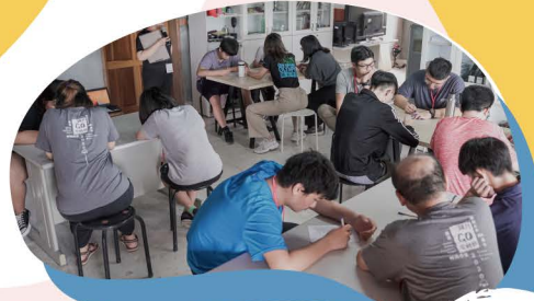
設有專屬諮商中心，透過諮 商師引導下學習道別、道愛。

認識悲傷階段， 用自己的步調走過 失去、重大傷害的悲傷歷程， 悲傷不會沒有盡頭 只要您願意再次出發。